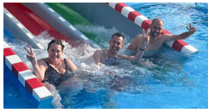
Stolze drei Bahnen umfasst die neue Racer-Rutschbahn im «aqua-life».